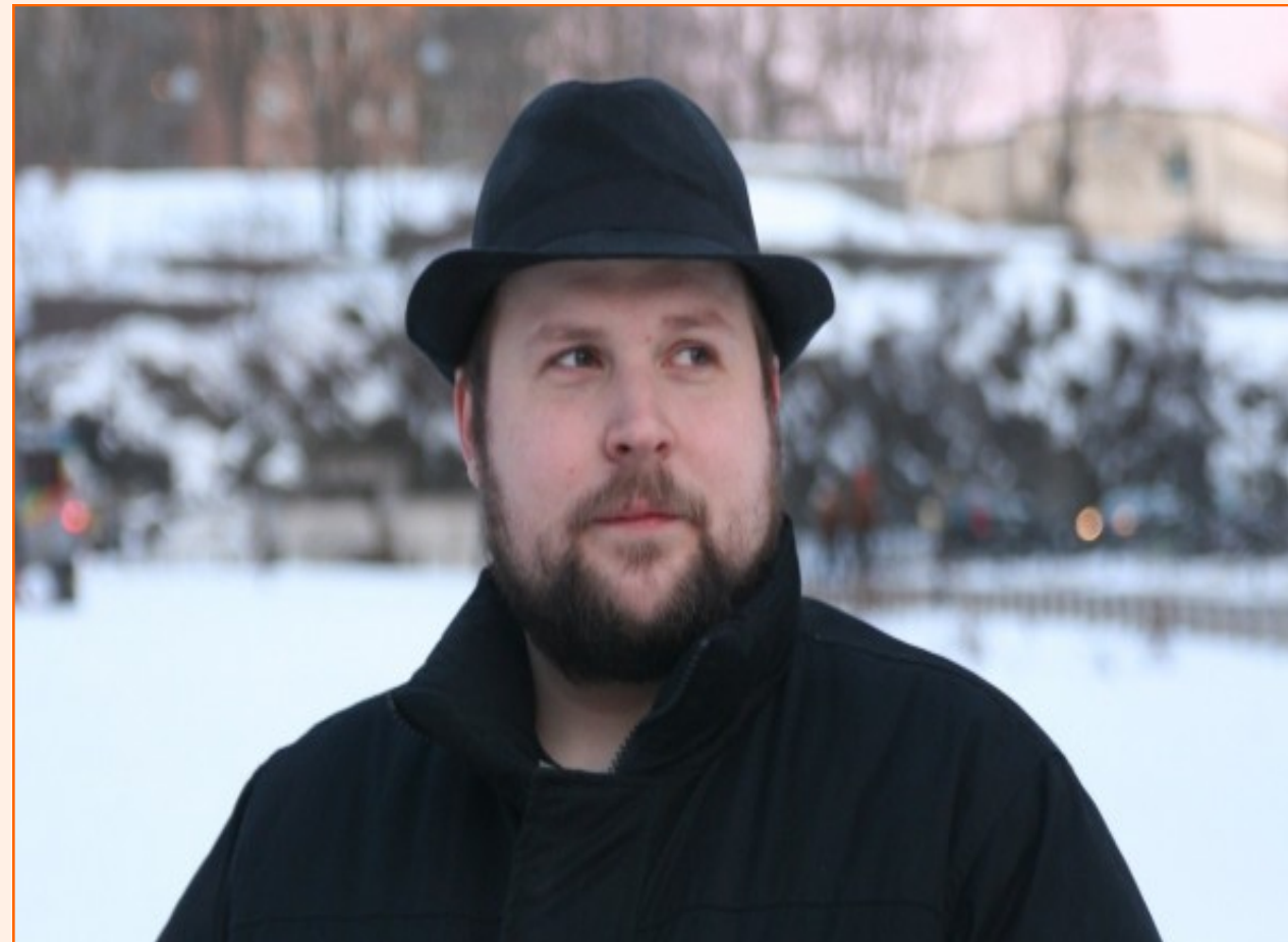
Notch im echten Leben