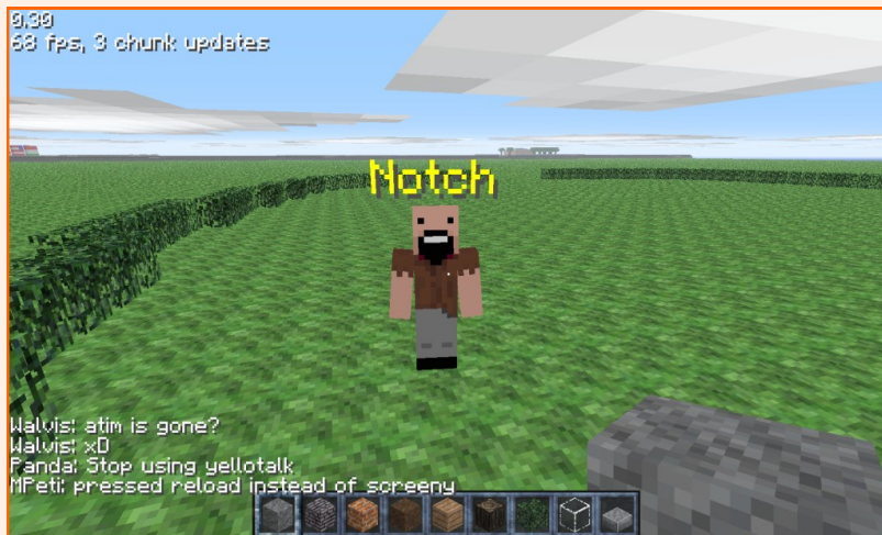
Notch in Minecraft

So kann er euch helfen (aber ziemlich kompliziert) tiefe Löcher zu graben. Es gibt die verschiedensten Arten von Gesteinen in Minecraft: Redstone (wird benötigt um technische Schaltkreise zu erstellen), Diamant (Für Rüstungen und Waffen), Lapis Lazuli (eigentlich nur für Farben), Gold/Eisen (Rüstung und Waffen) und Kohle (für Fackeln und den Schmelzofen). Es gibt zudem spezielles Feuer. Daraus kann man sich eine Kettenrüstung machen. Man kann es nicht normal erhalten.